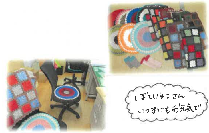
「ぼてじやん」さん いつまでもお元気

寄贈いただきました！ 「ぼてじやん」さんは、中央市民センターに週1回月曜午後には集まり、寄付いただいた手糸を使って、円座とひざ掛けを編んで、毎年、福祉施設に寄贈する活動を30年以上されています。円座は事務用で、ひざ掛けは赤ちゃんのお布団にも使わせていただいています。ありがとうございます！！